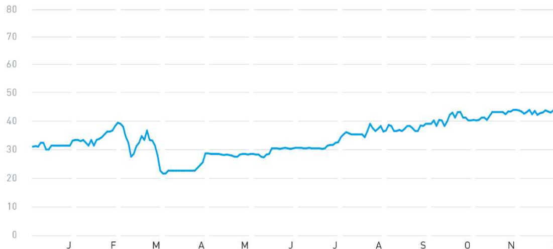
Kursverlauf SW Umwelttechnik Aktie in EUR